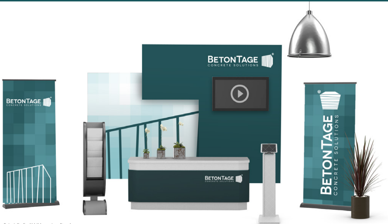
Beispielhafte Abbildung eines Standes in der virtuellen Ausstellung.

Mit den digitalen BetonTagen stellen wir Ihnen ein optimales Umfeld für den Informationsaustausch zwischen Ihnen und Ihren potentiellen Kunden bereit. Nutzen Sie diese innovative zeit-, kosten- und ressourcensparende Variante, um sich mit Kunden oder Interessierten auszutauschen und diese über Ihre Produkte und Leistungen zu informieren. Darüber hinaus müssen Sie keinen Aufwand für Reiseplanung, Übernachtung und Verpflegung aufwenden und können Ihre Ressourcen gezielt in die Ansprache Ihrer Zielgruppe investieren. Wir unterstützen Sie bei der Standgestaltung gerne mit allem, was Sie brauchen.